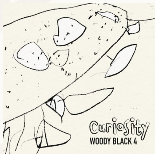
Curiosity (Unit Records, 2017)

„Auf „Curiosity“ entzündet sich ein musikalisches Feuerwerk, das in buntesten Farben lichterloh und spektakulär abbrennt und wirklich mit etwas gänzlich Neuem aufwartet. Es ist hier der unglaublich vielschichtige und ungemein variantenreiche Sound, der neben aller an den Tag gelegten musikalischen Finesse den alles entscheidenden Unterschied ausmacht.“