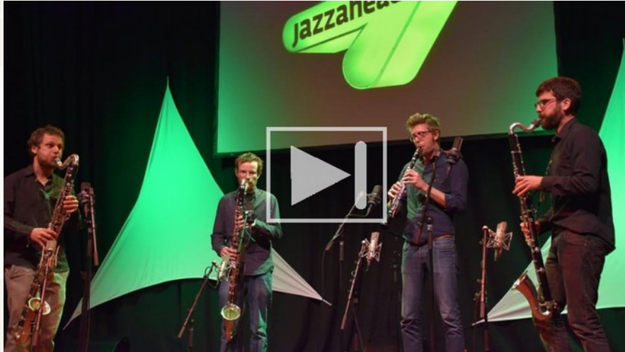
Teaser at Jazzahead! 2016