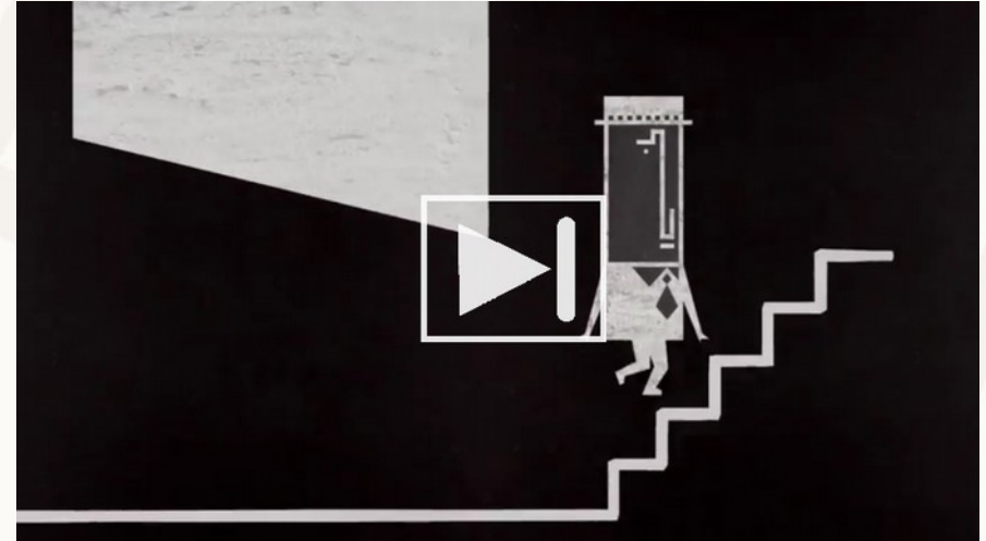
Mr. Bassclarinet Animation Series