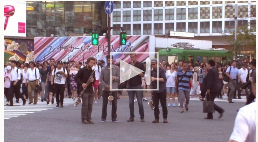
Videoclip „Shake for your Sake“ Around Tokyo